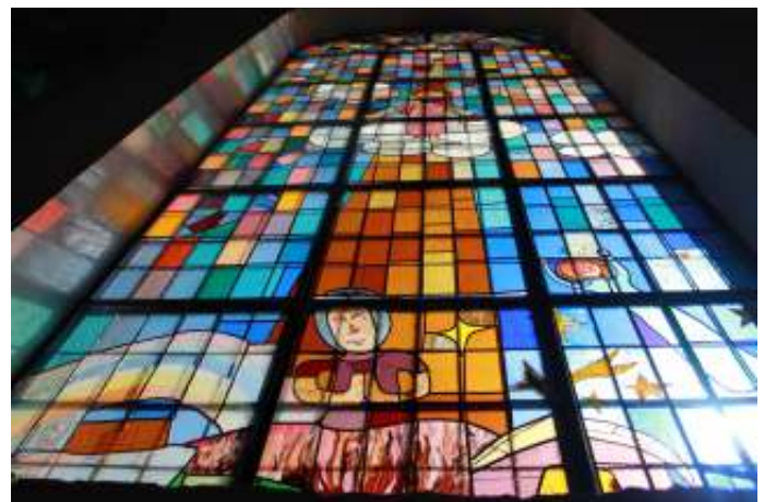
Glas-in-lood-raam Bullekerk Zaandam (zie 'Mensen in beeld' p. 9)

Dinsdagavond 16 april om 19.30 uur in de Dorpskerk in Castricum (bijdrage: € 5,- incl. koffie/thee)